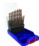
19 forets métaux HSS taillé meulé revêtus FUSIO affûtage Tivoly Smart Point Ø 1 à 10mm