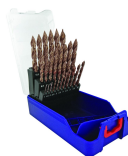
25 forets métaux HSS taillé meulé revêtus FUSIO affûtage Tivoly Smart Point Ø 1 à 13mm